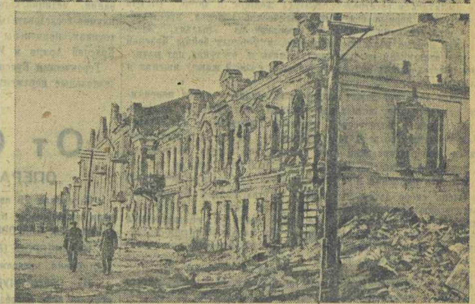
ЗЛОДЕЯНИЯ НЕМЦЕВ В ПОЛТАВЕ. Отступая из Полтавы, гитлеровцы варварски надругались над памятниками культуры украинского народа, разгромили и сожгли Полтавский Исторический музей, сожгли живьем много жителей Полтавы, взорвали и уничтожили сотни зданий города. На снимках: 1. Разбитый гитлеровцами бюст великого украинского поэта Тараса Шевченко, находившийся в Историческом музее. 2. Группы захваченных в здании музея жителей Полтавы. 3. Разгромленные немцами экспонаты музея. 4. Улица Гоголя, сожженная и взорванная гитлеровцами.